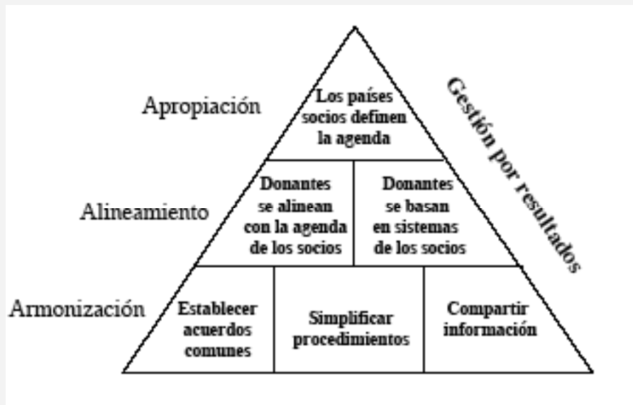
Cuadro 4: Principios de la Declaración de París (2005)